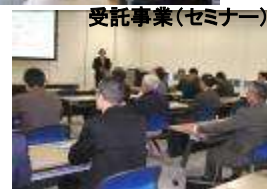
受託事業(セミナー)